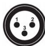
DMX – вход панельный разъем XLR «папа»