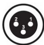
DMX – выход панельный разъем XLR «мама»